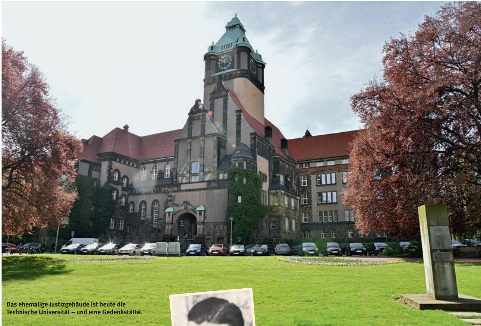
Das ehemalige Justizgebäude ist heute die Technische Universität – und eine Gedenkstätte.