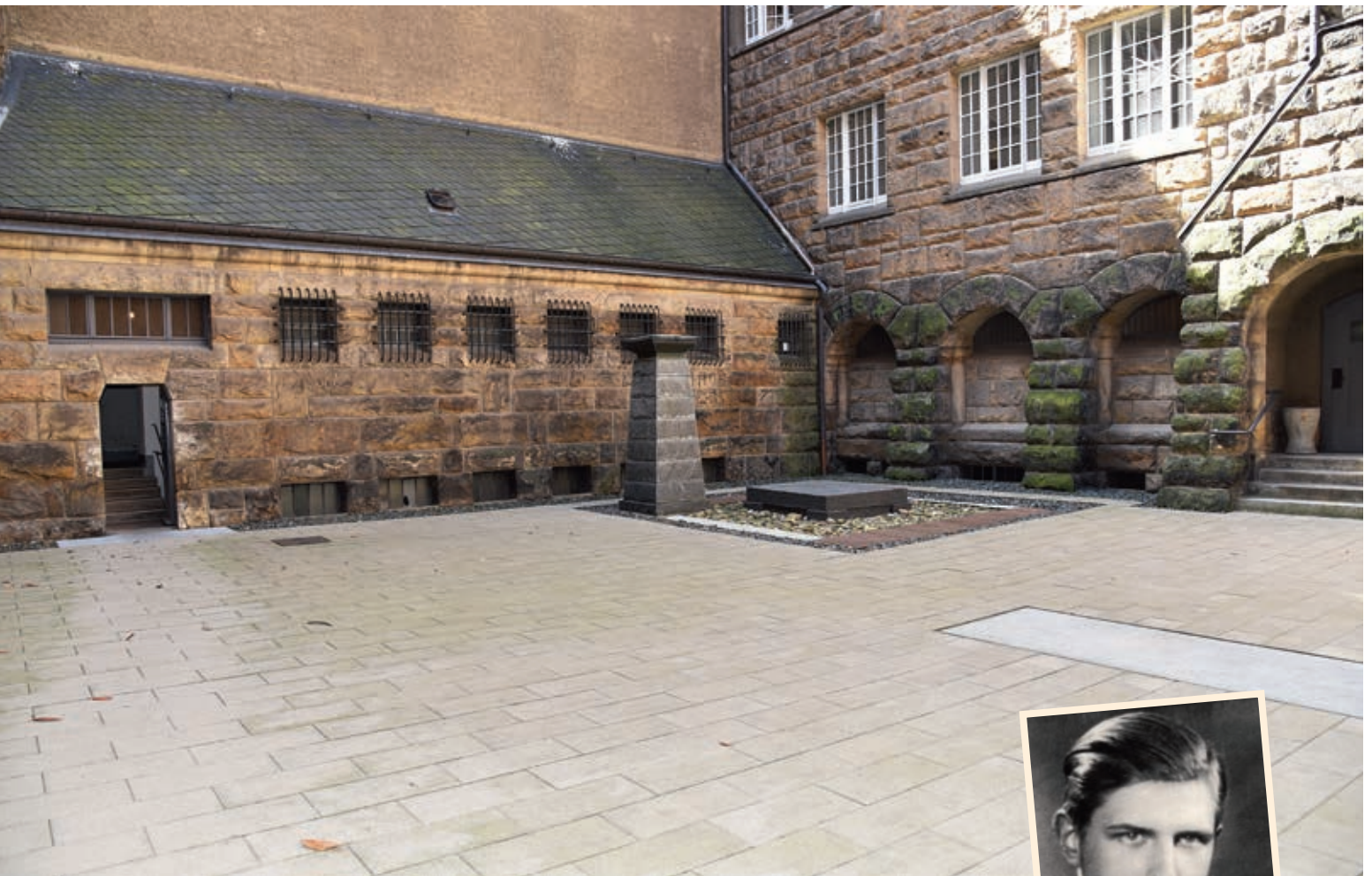
Innenhof des ehemaligen Dresdner Justizgebäudes: Hier ließen die Nazis 1.343 Menschen enthaupten. Der helle Stein rechts markiert den Ort, an dem die Guillotine stand.