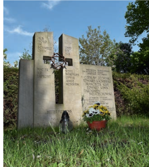
Gedenken an die Märtyrer in Dresden: Gedenkstein auf dem Neuen Katholischen Friedhof (oben) und die Skulptur „Befreiung“ am Märtyreraltar in der Hofkirche (links).