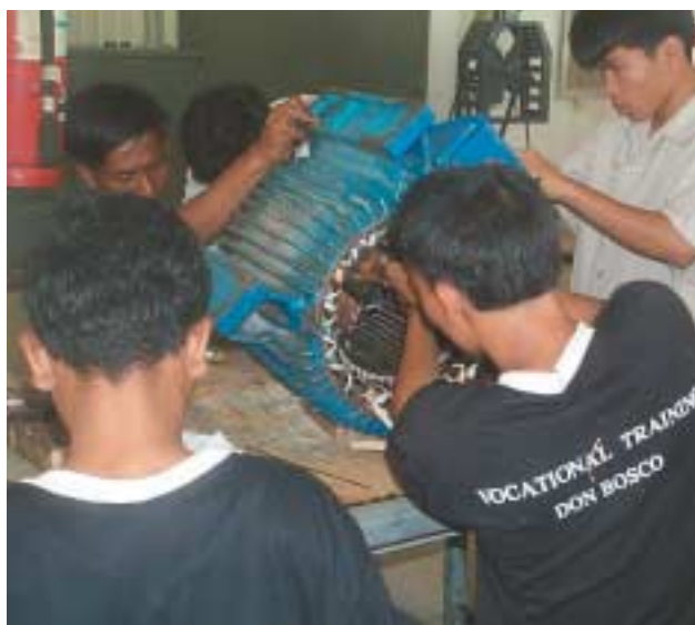
Auch in Entwicklungsländern werden Schlüsselqualifikationen verlangt

Vormittags Schule, nachmittags Arbeit: Diese Regelung ist kein Muss. Wer schon die staatliche Schule besucht hat, kann auch nur die praktische Ausbildung machen oder erst mal grundlegende Techniken wie Sägen oder Mauerbau lernen. Analphabeten haben die Möglichkeit, neben der Ausbildung stundenweise zur Schule gehen, minderjährige Schuhputzer oder Straßenhändler kommen nach der Arbeit zum Lernen vorbei. An Wochenenden und am Abend gibt's Kurse für Schulabbrecher und Eltern, zum Beispiel im Lesen und Schreiben, Nähen oder Hauswirtschaft.