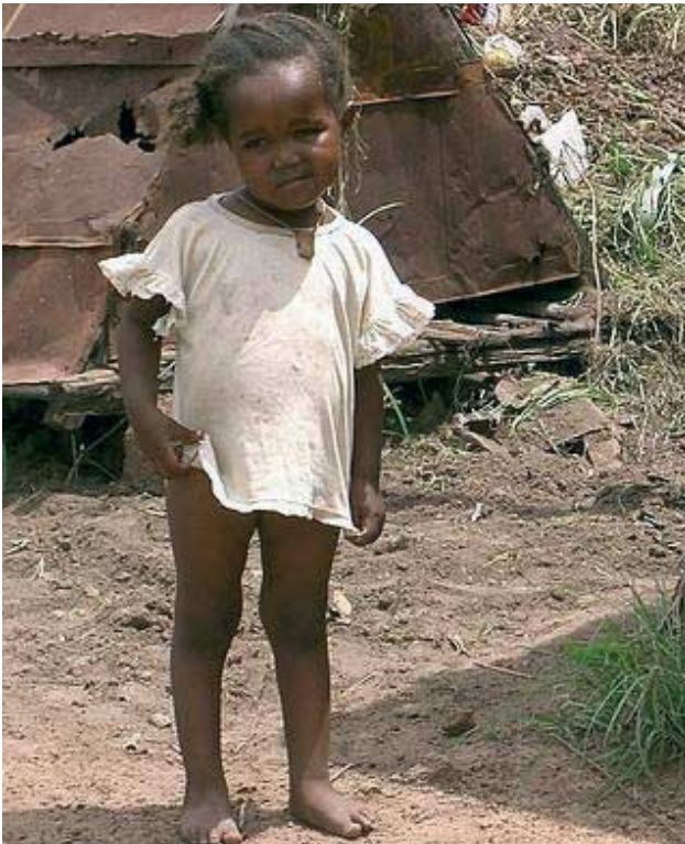
Jedes Kind hat Recht auf Leben