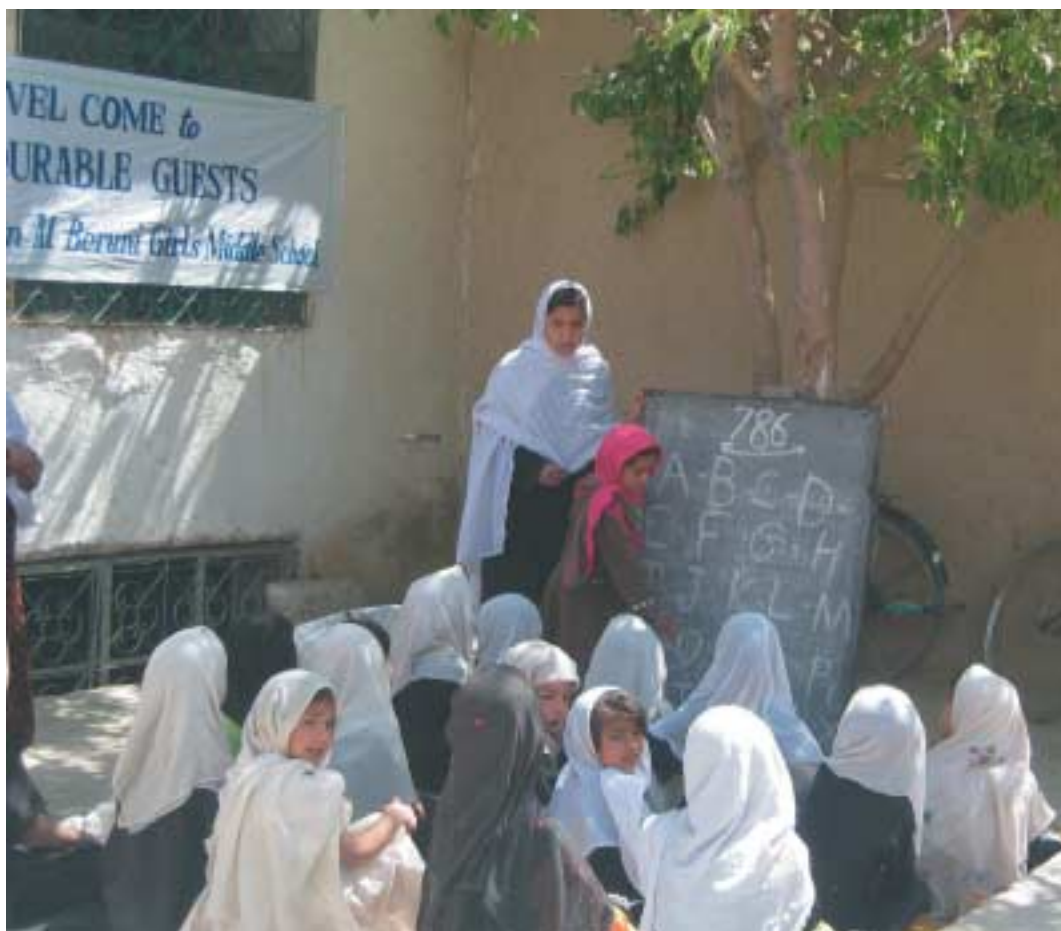
Schulbildung ist Lebensgrundlage, aber in vielen Ländern Luxus

Sich aus einem christlichen Selbstverständnis heraus weltweit für arme und benachteiligte Jugendliche einsetzen: Damit führen wir weiter, wofür sich Jesus zu seiner Zeit stark gemacht hat. Wir vermitteln christliche Grundwerte, die unsere Gesellschaft entscheidend geprägt haben: