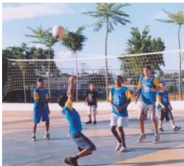
Sport ist integraler Bestandteil jeder Salesianereinrichtung