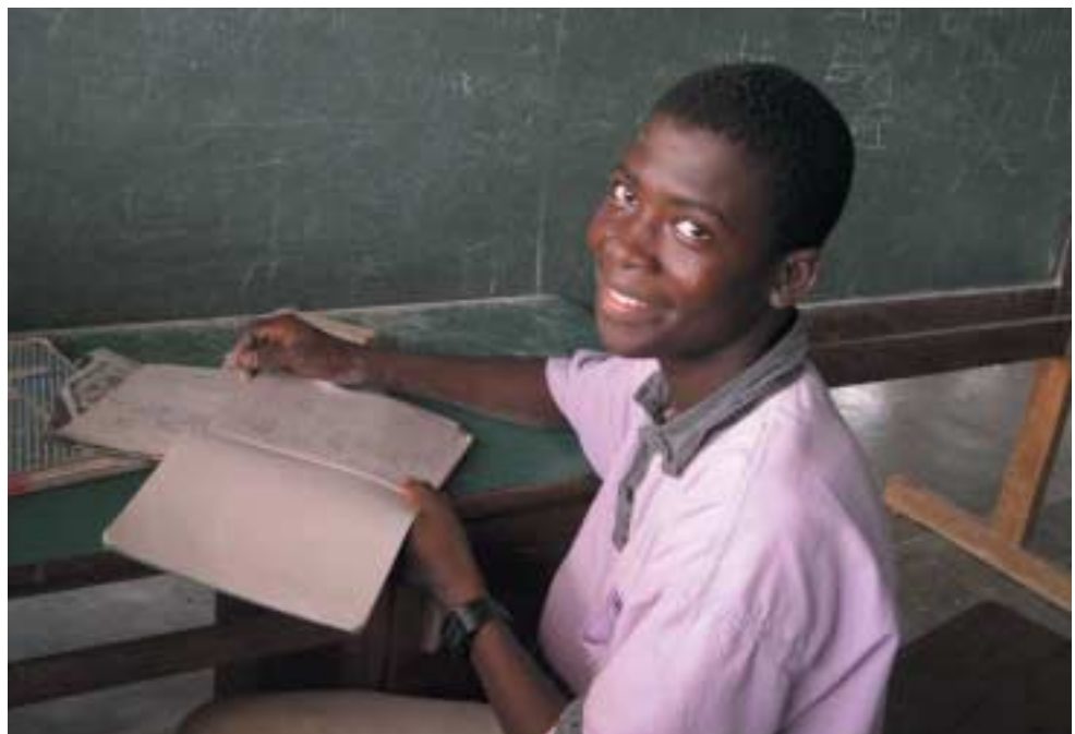
Bildung ist der Schlüssel im Kampf gegen Armut

Schule, Ausbildung, Hausaufgaben – wenn Jugendliche damit beschäftigt sind, sind sie nicht auf der Straße, stehlen nicht und nehmen keine Drogen. Und mit einem Schulabschluss gibt es eine Alternative zur kriminellen Karriere oder täglichen Tristesse. Bildung hilft, Selbstbewusstsein und Eigeninitiative zu stärken für ein Leben in Selbstbestimmung und Würde.