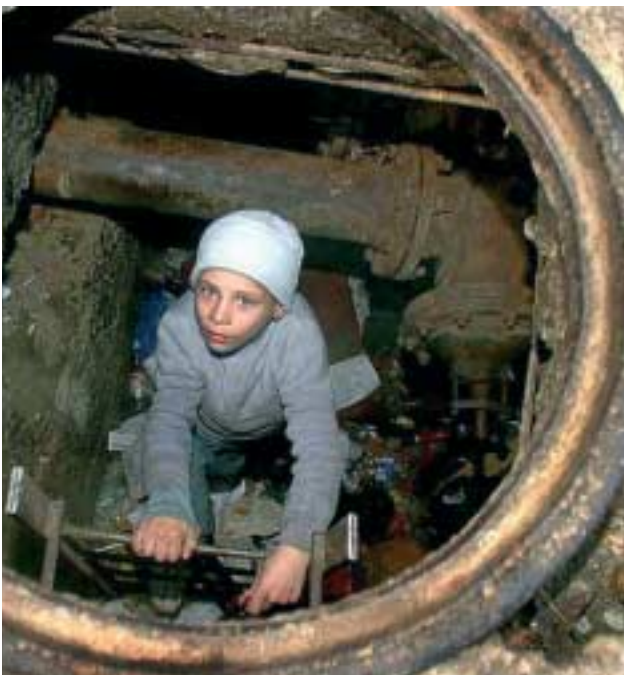
Schlafplatz unter der Erde: Straßenkind in Konstanza

An den oben genannten Merkmalen erkennt man noch heute jede Salesianer-Einrichtung in Deutschland und der ganzen Welt. Bis heute haben die Ideen Don Boscos nichts von ihrer Aktualität verloren. Jugendliche zu erziehen, ohne sie zu erniedrigen oder zu misshandeln, ihnen Regeln und Moral mit auf den Weg zu geben – das passt in die aktuelle Wertediskussion. Das Recht auf ein menschenwürdiges Leben und Bildung findet sich in der UN – Kinderrechtskonvention wieder. Denn wie Don Bosco hat man überall erkannt: Mit Vertrauen, Förderung und einem Job, der sie ernährt, haben Jugendliche eine Zukunft.